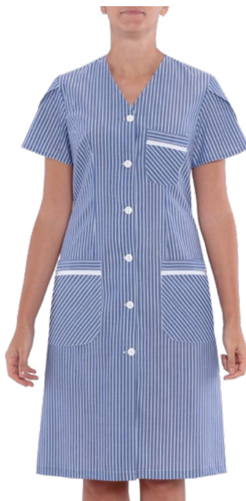
R035 Avio stripe